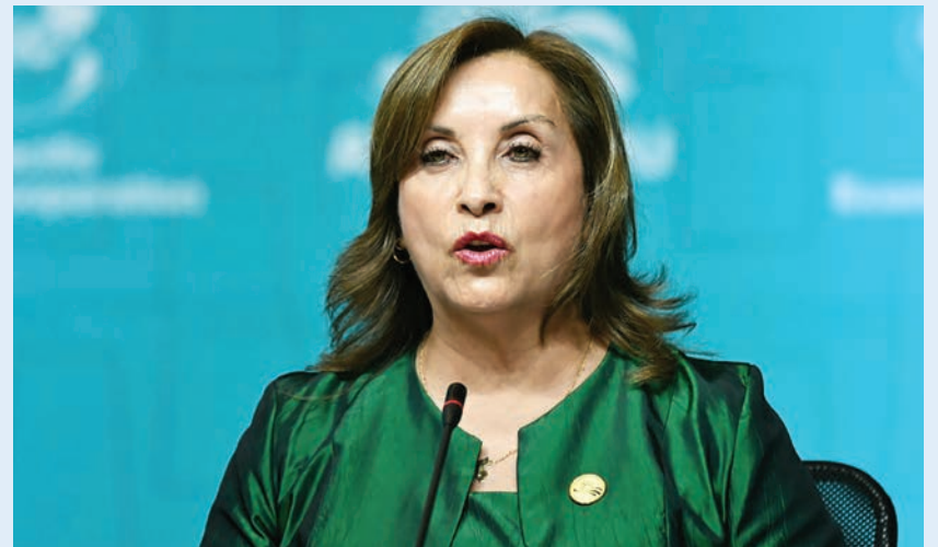
La presidenta de Perú, Dina Boluarte, en una rueda de prensa tras una cumbre del foro APEC, en Lima, el 16 de noviembre de 2024