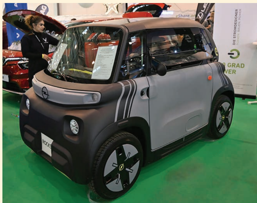
Un ejemplar del Opel Rocks-e, automóvil eléctrico del grupo Stellantis, expuesto en la Feria del Automóvil de Essen, el 4 de diciembre, en la ciudad alemana.

La firma está construyendo su segunda fábrica europea en Hungría tras haber puesto en marcha una en Alemania en enero de 2023.