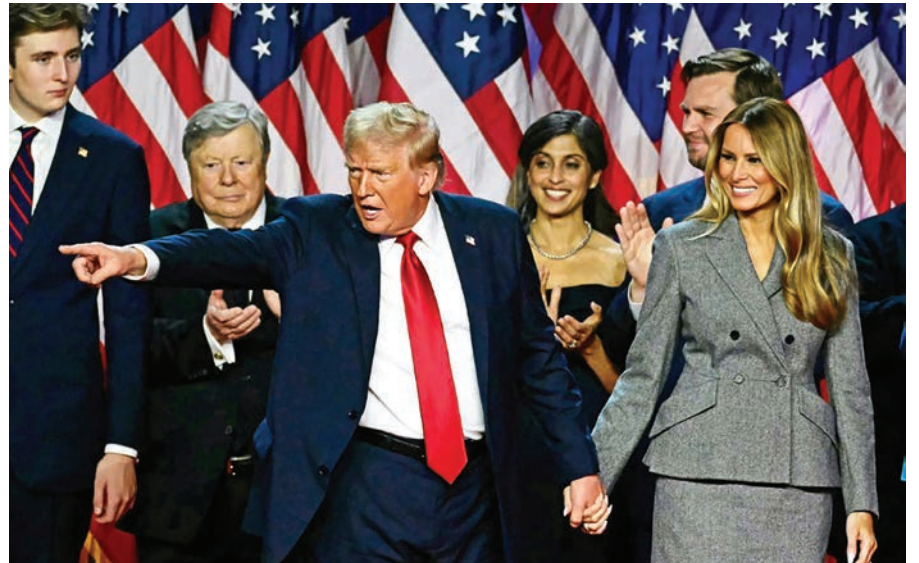
Donald Trump celebra su victoria presidencial el 5 de noviembre de 2024 en West Palm Beach, Florida

También hay un sinfín de hombres y mujeres de negocios adinerados en puestos de embajadores o como directores de agencias federales, la mayoría de los cuales han contribuido económicamente a la campaña de Trump.