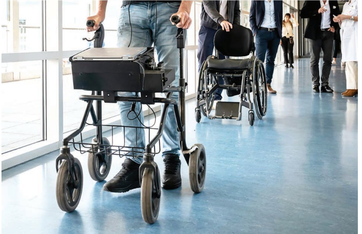
La estimulación profunda de ciertas áreas del cerebro es una esperanza para algunas personas con lesiones de la médula espinal

La técnica, aún experimental, está dirigida a personas con lesiones incompletas de la médula espinal –cuando la cone-