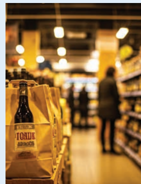
Wes Moore apoya eliminar la prohibición.

“Maryland es uno de los pocos estados en el país donde los consumidores solo pueden adquirir cer-