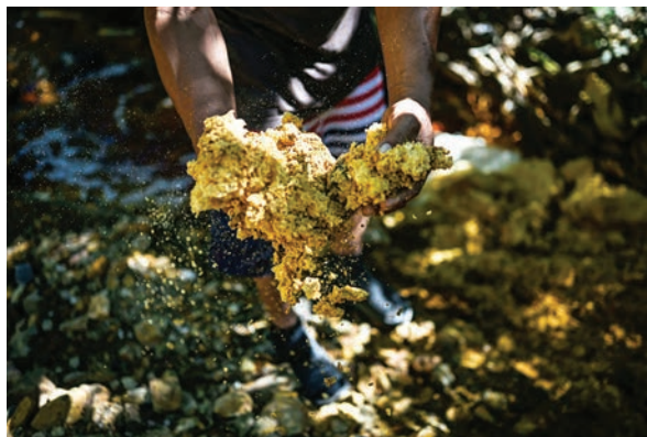
Un hombre muestra residuos químicos extraídos del río San Sebastián, contaminado por la actividad minera, en Santa Rosa de Lima, departamento de La Unión, El Salvador.

Centroamérica no posee tradición minera, como los países andinos. La minería a cielo abierto es ilegal en Costa Rica, aunque el gobierno espera autorizarla de nuevo, y Panamá declaró una moratoria minera hace un año, tras paralizar una enorme mina de cobre luego de un mes de protestas.