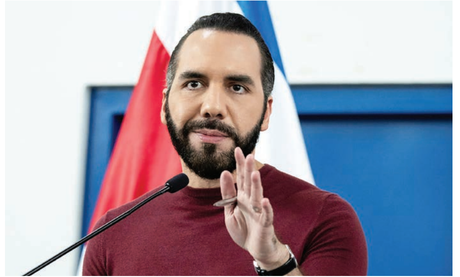
El presidente de El Salvador, Nayib Bukele, visita el centro penitenciario Jorge Arturo Montero Castro, en Alajuela, Costa Rica, el 12 de noviembre de 2024.