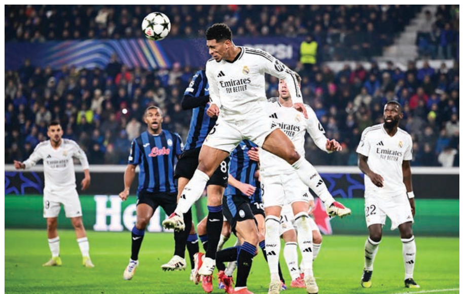
El centrocampista inglés del Real Madrid Jude Bellingham salta por el balón durante el partido de fútbol de la UEFA Champions League ante el Atalanta en el Estadio Gewiss en Bèrgamo.

En su visita al Rayo, la presencia de Mbappé está en duda, después de haberse retirado en Bèrgamo por molestias musculares. La buena noticia para el francés llegó de Suecia este jueves. La fiscalía escandinava archivó la investigación por supuesta