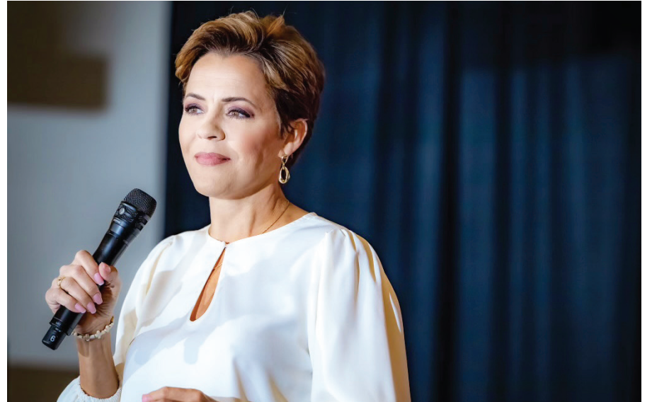
Kari Lake , designada por Donald Trump como directora de Voice of America, promete llevar los valores de “libertad y democracia” al público global, en medio de críticas y controversias sobre su trayectoria política y mediática.

Al asumir el cargo en enero de 2021, la administración del presidente Joe Biden removió rápidamente a varios funcionarios vinculados a Trump en Voice of America