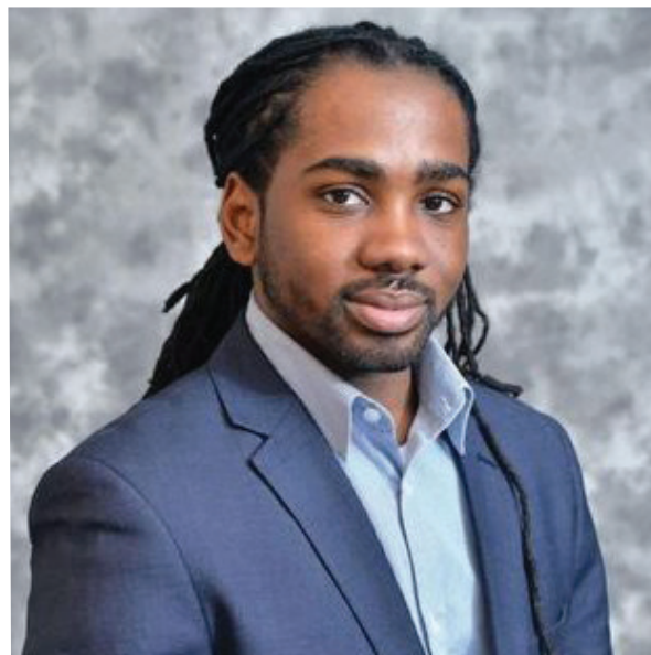
Trayon White, miembro del Consejo de DC, enfrenta acusaciones de soborno.

El informe, elaborado por el bufete Latham & Watkins, concluye que White recibió $35,000 en efectivo de un empresario vinculado a negocios que buscaban contratos con DC. A cambio, White acordó