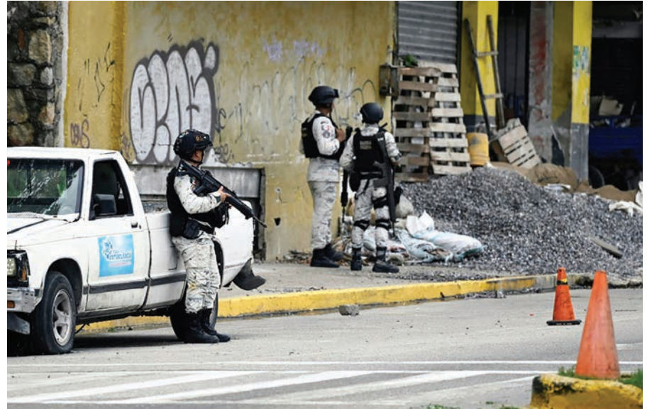
Un control de la Guardia Nacional mexicana en Acapulco, en el estado de Guerrero, en una imagen del 10 de septiembre de 2024

Desde diciembre de 2006, cuando se implementó un controvertido operativo militar antidrogas, se han registrado más de 450,000 muertes violentas y decenas de miles de desapariciones en México, según cifras oficiales. Guerrero sigue siendo uno de los estados más afectados, con una constante disputa entre grupos criminales que agravan la inseguridad y la violencia en la región. El asesinato del juez Román Pinzón es un recordatorio más de los riesgos que enfrentan los operadores de justicia en un país golpeado por el crimen organizado.