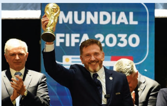
El presidente de la Conmebol, Alejandro Domínguez, levanta una réplica del trofeo del Mundial después de la confirmación de que Paraguay, Uruguay y Argentina acogerán un partido cada uno del Mundial-2030. En Luque (Paraguay).

“¡El sueño es realidad! Paraguay recibirá la Copa Mundial de la FIFA en el año 2030, tras el anuncio oficial en el Congre-