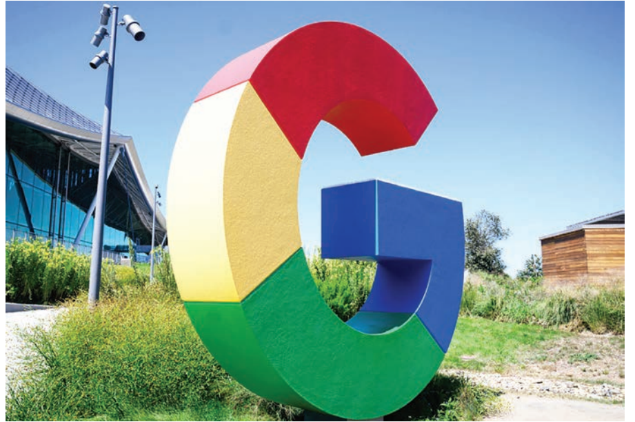
Google, OpenAI, el creador de ChatGPT, así como los gigantes Meta y Amazon están tomando medidas frenéticas para lanzar modelos de IA más potentes a pesar de su inmenso costo y algunos cuestionamientos sobre su utilidad inmediata para la economía en general

Gemini 2.0 representa un paso significativo en esta dirección, consolidándose como un agente de IA capaz de transformar la manera en que las personas acceden a la información y resuelven problemas co-