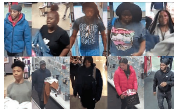
Los 10 sospechosos captados por cámaras de seguridad.

■ 11 de agosto: CVS Pharmacy, 3820 Chaplin Place ■ 23 de agosto: Tar-