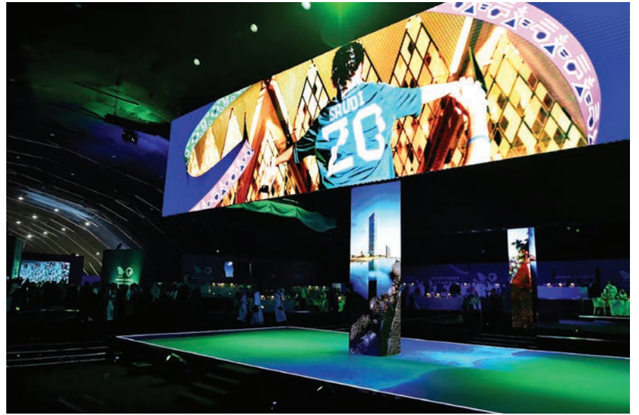
Escenario de la ceremonia organizada en Riad con motivo de la nominación de Arabia Saudita como sede del Mundial de fútbol-2034

“Un sueño hecho realidad. Portugal va a recibir el Mundial 2030 y nos llena de orgullo. ¡Unidos!”, escribió la estrella del fútbol portu-