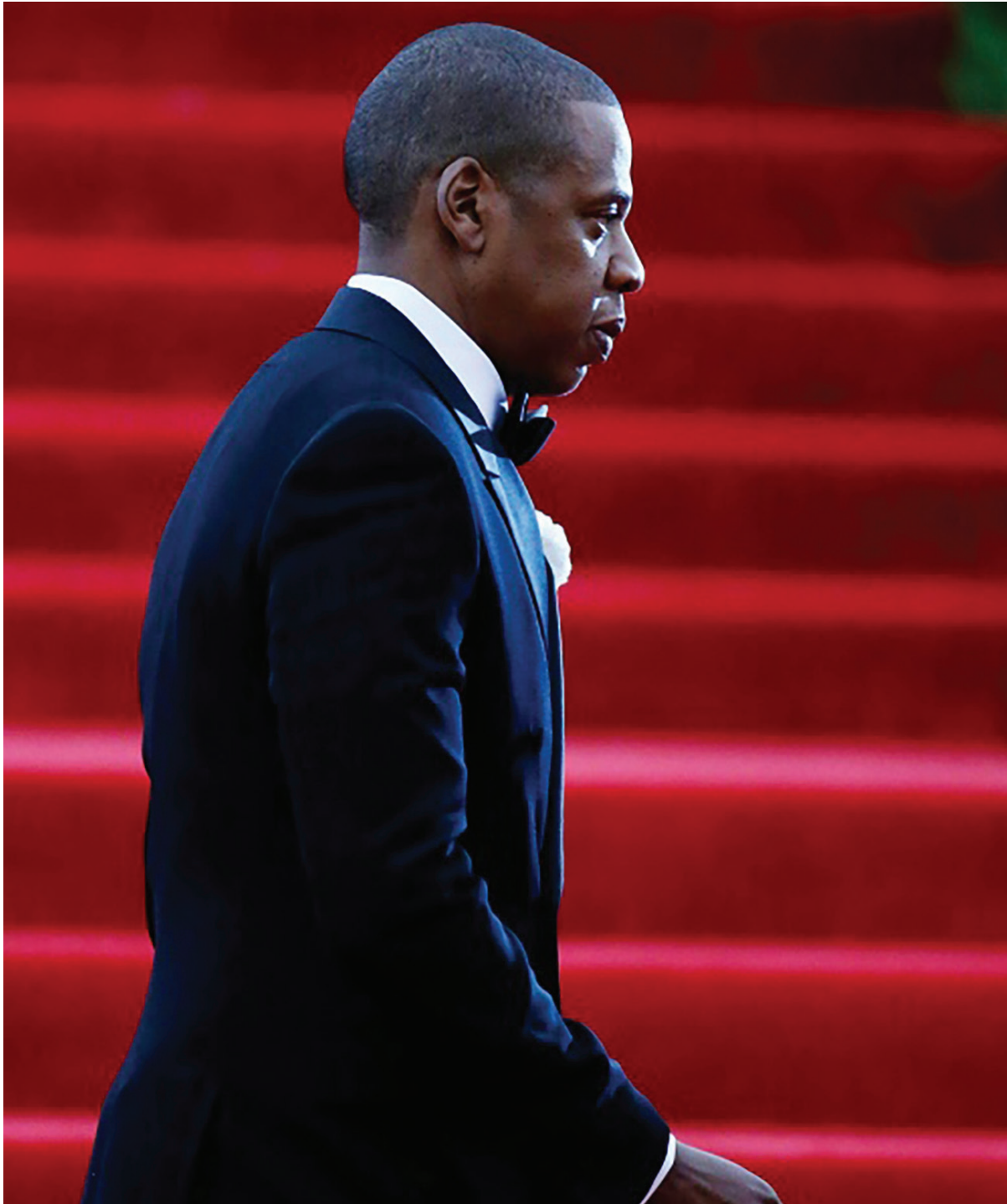
Shawn Carter, más conocido por su nombre artístico Jay-Z, es un músico, productor discográfico y empresario multimillonario que empezó como rapero y ahora está casado con la superestrella Beyoncé.

“Mi abogado recibió un intento de chantaje, llamado carta de demanda, de un ‘abogado’ llamado Tony Buzbee. Lo que él había calculado era que la naturaleza de estas acusaciones y el es-